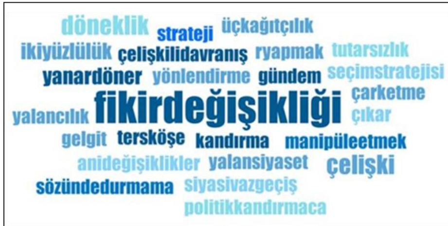
Şekil 2. Flip-Flop’u adlandırma temaları (Figure 2. Flip-flop naming themes)

Katılımcıların flip-flop olgusuna ilişkin adlandırmaları, kavramın ağırlıklı olarak tutarsızlık ve güven kaybı ekseninde anlamlandırıldığını göstermektedir. Katılımcılar olguyu çoğunlukla “yanar dönerlik”, “döneklik” ve “iki yüzlülük” gibi ifadelerle tanımlayarak siyasal söylemde samimiyetsizlik ve güven erozyonuna vurgu yapmaktadır. Bunun yanında bazı katılımcılar değişimi “fikir değişikliği”, “çark etme” ya da “siyasi vazgeçiş” gibi terimlerle açıklayarak “Fikir Değişikliği ve Dönüşüm” alt temasında daha nötr bir anlam atfetmektedir. Son olarak, “Bağlamsal Etkenler” alt temasında flip-flop, belirli lider örnekleri, seçim stratejileri ve güncel siyasal koşullar üzerinden açıklanmaktadır (Şekil 2).